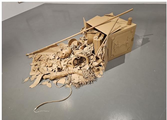
Installation de l'artiste Pedro Valdez Cardoso

De nouvelles acquisitions enrichissent chaque année cette collection.