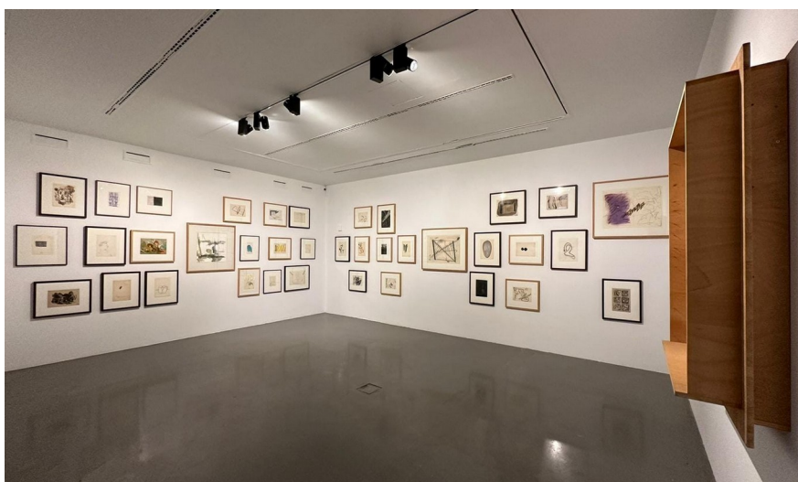
Ensemble d'œuvres de l'artiste Pedro Cabrita Reis, dates et dimensions diverses.

L'exposition est composée uniquement d'œuvres de la fondation Carmona e Costa, la plus grande collection privée portugaise. C'est la première fois que ces œuvres sont présentées au public et à la critique.