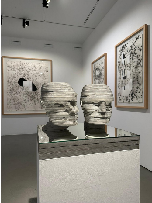
(Premier plan) Sans titre, 1998 : sculpture de Pedro Sanches marbre bleu de Cascais et miroir.

Depuis 2003, elle réalise des projets dans le cadre de son programme de Soutien à l'art contemporain au Portugal en partenariat avec d'autres institutions et/ou spécialistes, axés sur le domaine du dessin compris comme une pratique transversale à toutes les disciplines artistiques.