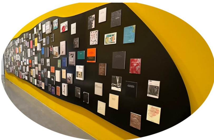
Mur de 218 catalogues édités par la fondation. Conception de l'installation par Pedro Calapez.

L'exposition « Album de famille » a ouvert ses portes au MAAT (Musée d'art d'architecture et technologie) à Lisbonne, le 5 octobre et restera présente dans ses locaux jusqu'au 1 er avril 2024.